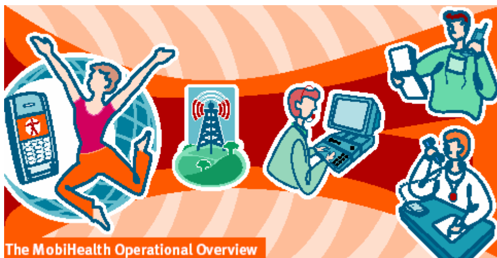
Figuur 2: Infrastructuur MobiHealth 12

De infrastructuur achter MobiHealth is het gebruik van een Body Area Network (BAN), een Back End System (BESys) en een End user host. Doordat er verschillende fases in de MobiHealth infrastructuur zitten is er sprake van een intra-BAN, de communicatie tussen de sensoren, de Front-end en de Mobile Based Unit (MBU), en een extra-BAN, de communicatie tussen de MBU en het Back End System.